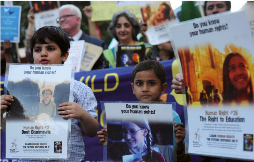
유엔 아동권리협약은 가장 널리 비준된 국제인권조약이다. 협약은 당사국에 의한 협약 이행을 감시하기 위한 18명의 독립전문가로 이루어진 위원회를 설립하였다.