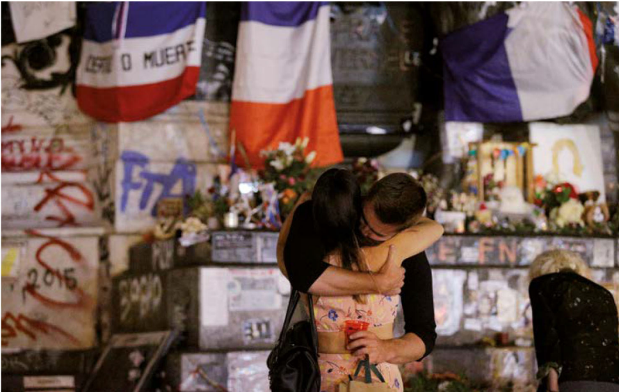
테러는 국가 및 당숙, 평화와 안전성 및 사회적 균형을 파괴하는 것을 목적으로 한다. 이는 또한 인권을 저해한다. 그러나 대테러 조치는 효과적이고 지속가능하기 위해 반드시 인권 및 법치의 존중에 굳게 기반해야 한다.