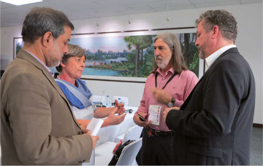
국회의원의 인권에 관한 IPU 위원회 구성원, 제135차 IPU 총회, 2016년 3월, 잠비아 루자카