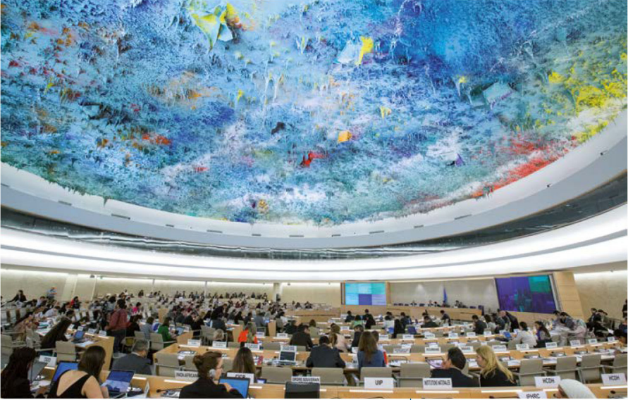
2016년 6월 스위스 제네바에서 개최된 인권이사회 제32차 회기 “모든 인권 침해 피해자는 인권이사회를 행동을 위한 포럼 및 출발점으로 여길 수 있어야 한다” 반기문, 유엔 사무총장