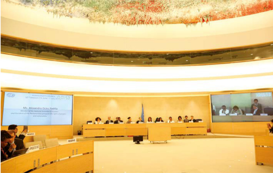
인권이사회 및 국가별 인권상황 정기검토에 대한 국회의 기여에 대하여 진행된 패널 논의, 2015년 6월, 제네바.