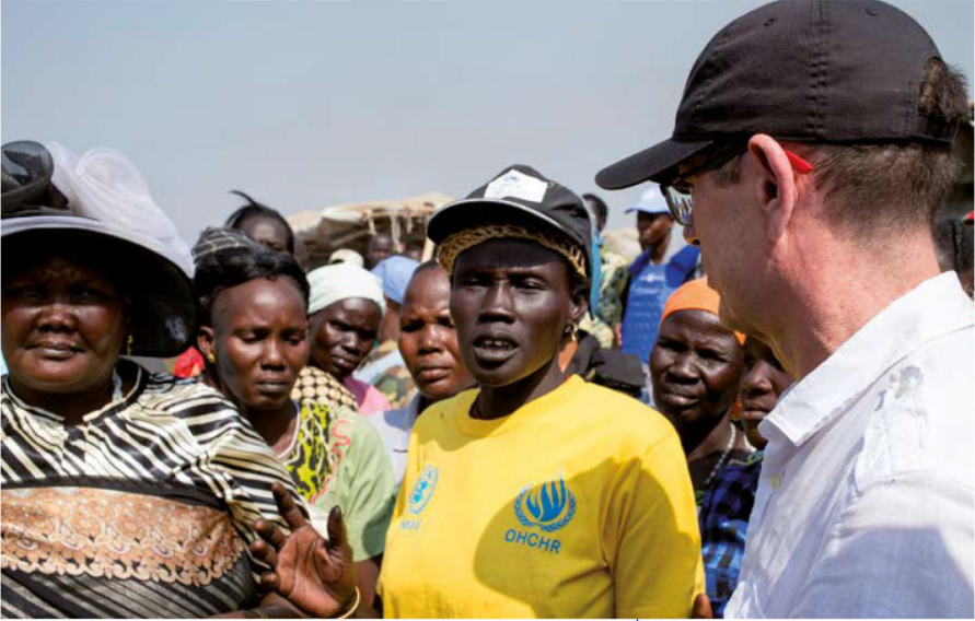
정보 수집 임무 동안 남수단의 인권상황에 대해 지역주민과 대화하는 OHCHR 직원.