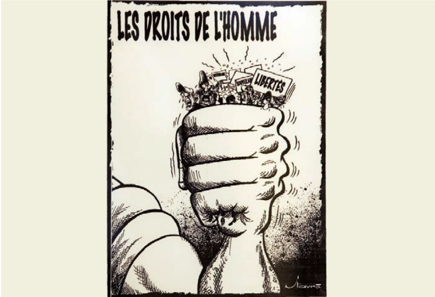
레바논 예술가인 스타브로 자바라에 의한 카툰, 유엔 뉴욕 본부, 메인 갤러리의 “인권을 그리다”라는 전시의 일부.