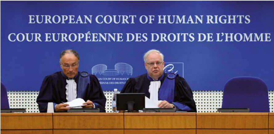
지역 인권재판소 중 하나인 유럽인권재판소는 유럽인권협약을 비준한 47개 유럽 평의회 회원국의 8억 명의 유럽인에 대한 인권을 모니터링한다.