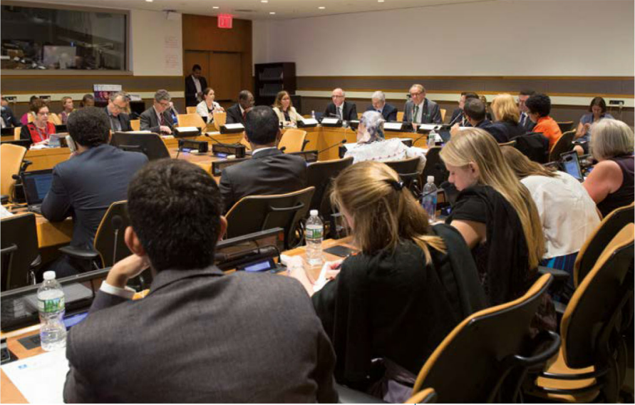
분쟁 및 취약한 상황에서의 국가인권기구의 역할과 평화적이고 평등하며 포용적 사회를 위한 기여에 대하여 논의 중인 이해관계자, 제4차 국가인권기구에 대한 연간 세미나, 뉴욕, 2016년 6월